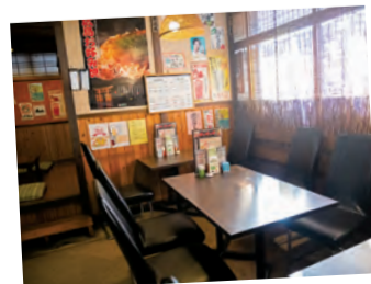
テーブル席は10席、座敷席は28席あります。

友人から勧められてホテルのアルバイトに応募した際も、お客さんと接点のない洗い場を希望したそうです。ところが人手が足りないという理由で、レストランのホール係を任されることに。気が乗らないまま現場に入りましたが、そこで出会った飲料部のトップの方に言われた「仕事は楽しめ」という言葉に衝撃を受けます。「苦手だと思っ前にまずは楽しめばいいのか、と目からウロコでした」と当時を振り返ります。積極的にお客さんと会話をするうちに、飲食業の面白さに魅了され、独立を視野