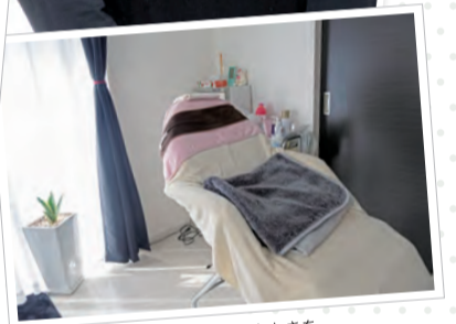
リラックスできる空間で癒しのひとときを

都度払い制に。満足のいくところで脱毛を完了することも可能なため、口コミでお店を紹介してくれるお客さんも増えてきたとか。