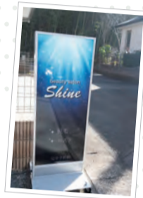
ブルーの看板が目印です